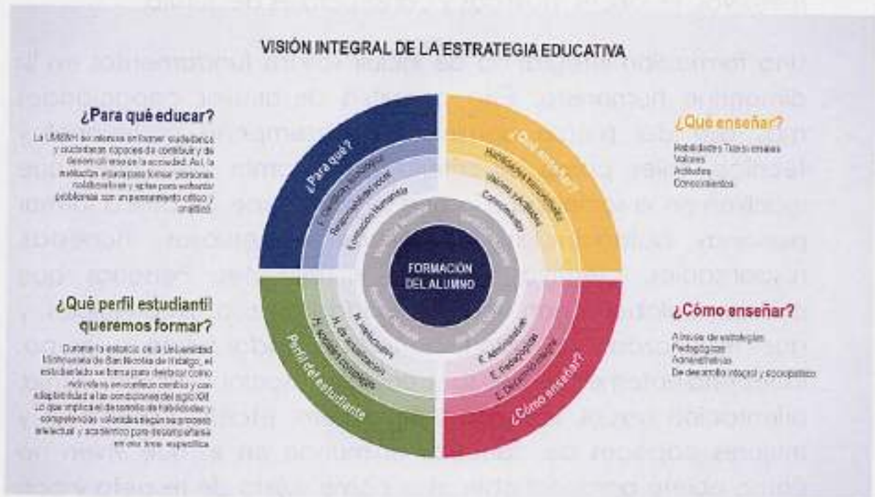
Figura 3. Visión Integral de la Estrategia Educativa

unos con otros para coadyuvar en el propósito que tiene la institución.