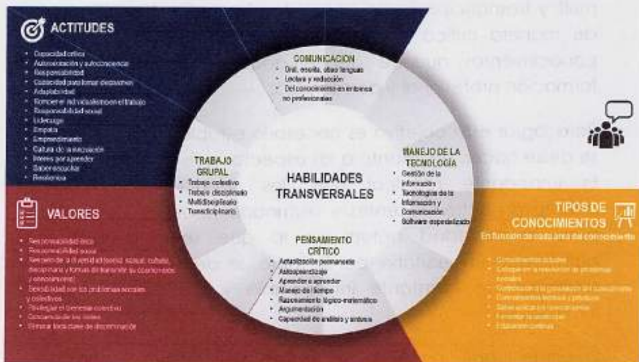
Figura 4. ¿Qué enseñar?

En segundo lugar, es de suma importancia que el alumnado recurra a diferentes perspectivas para desarrollar sus proyectos, esto con la finalidad de que en un futuro sean capaces de trabajar y colaborar desde enfoques multidisciplinarios, transdisciplinarios e interdisciplinarios. Además, esto les permitirá crear un sentido de colectividad que favorecerá su convivencia en sociedad. Así, quienes egresen pueden vincular su conocimiento laboral con situaciones concretas del entorno social y determinar de qué modo pueden aportar elementos a la solución de problemas.