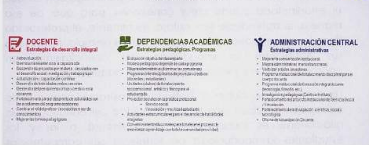
Figura 5. ¿Cómo enseñar?